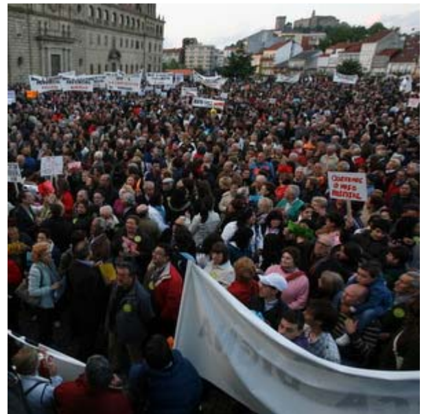
Varios intres da manifestación